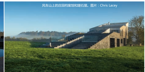
风车山上的庄园档案馆和燧石屋。