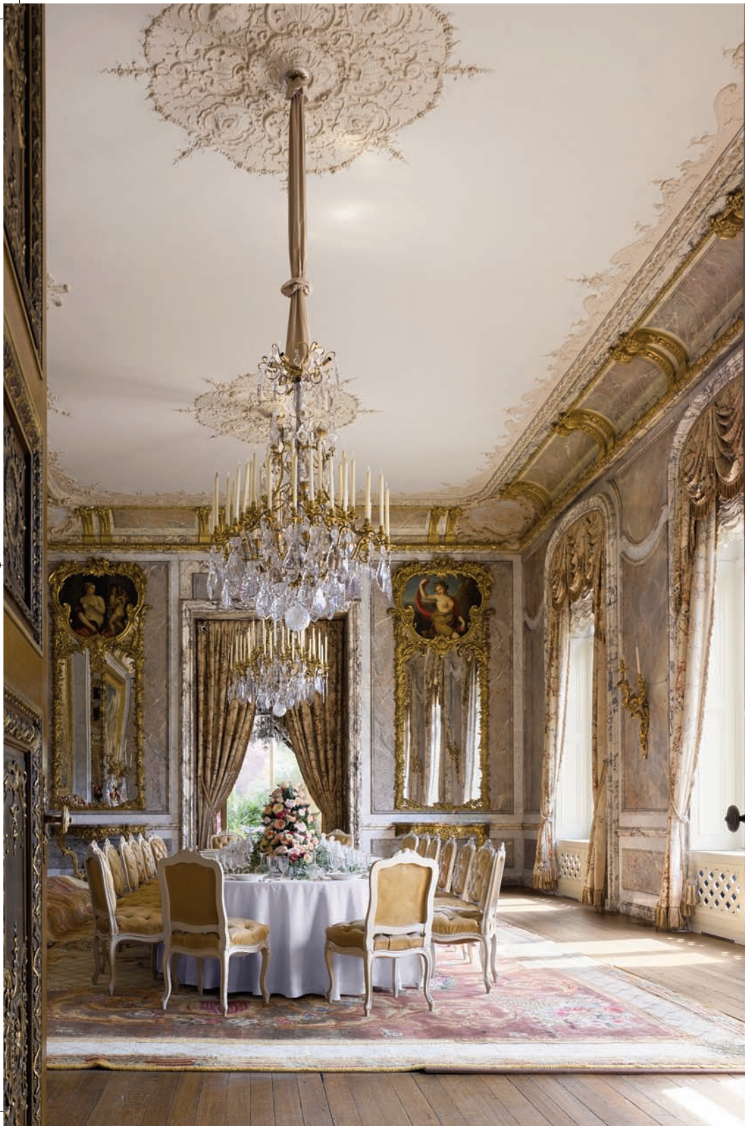
沃德斯登庄园餐厅、红色会客厅以及灰色会客厅